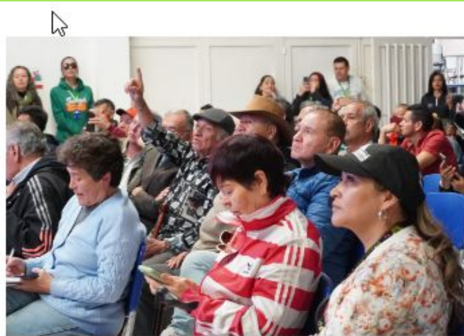
Segunda Jornada de Socialización del Ajuste a la Formulación del Plan Parcial de Renovación Urbana 'Centro San Bernardo