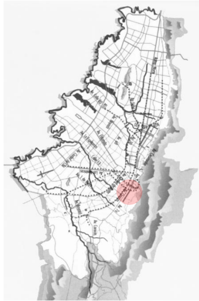
Imagen 1. Localización del sector en Bogotá.